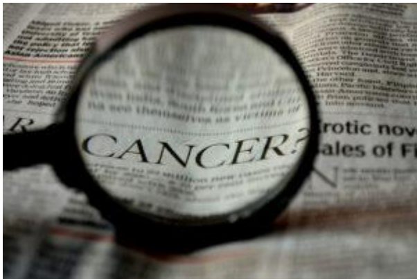
Fokus der Forschung: Krebs.

Auch 2024 wird ein Fokus der Forschung auf Krebs liegen – es ist schließlich noch immer die zweithäufigste Todesursache weltweit. Gearbeitet wird unter anderem an neuen Möglichkeiten der Immunonkologie: 13 Jahre sind seit der Einführung eines ersten Vertreters der Immunonkologika vergangen. Inzwischen sind diese Arzneimittel – die nicht direkt die Krebszellen angreifen, sondern dem körpereigenen Immunsystem helfen, selbst aktiv zu werden – aus der Therapie von immer mehr Tumorarten nicht mehr wegzudenken.